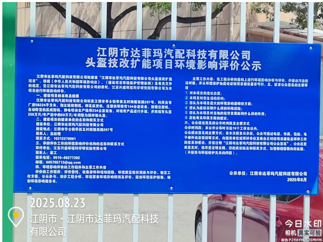
图 3.2-3 现场公示照片