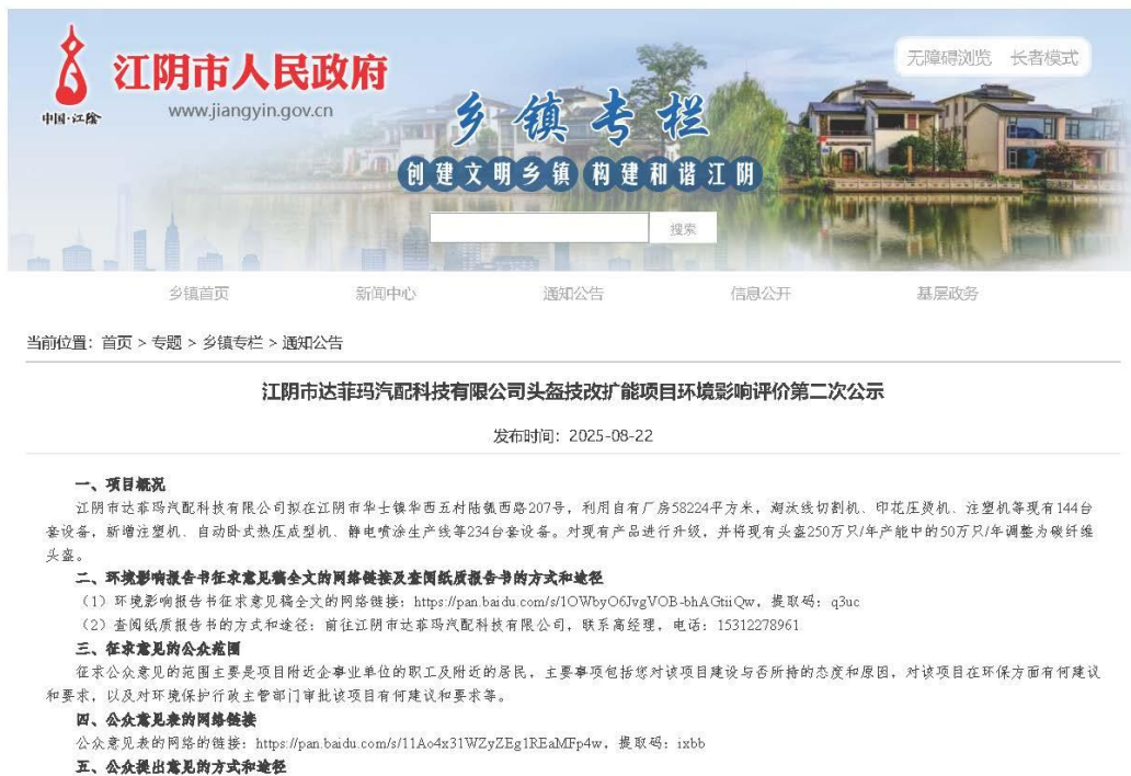
图 3.2-1 建设项目征求意见稿公示网上截图