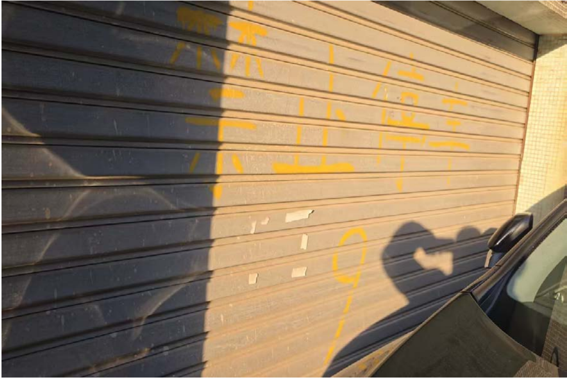
虹桥新四村车库 (8幢东 9#)