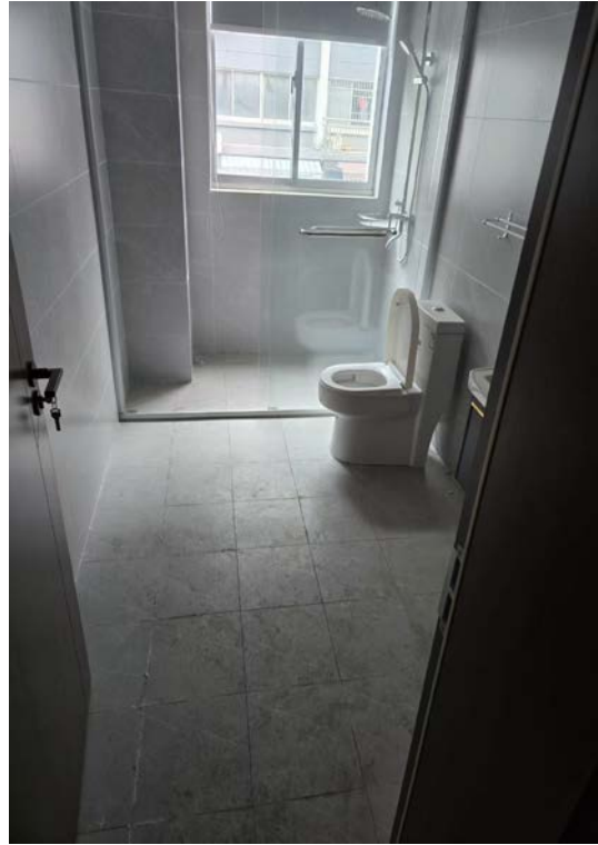
青果花苑 11 幢 107 室