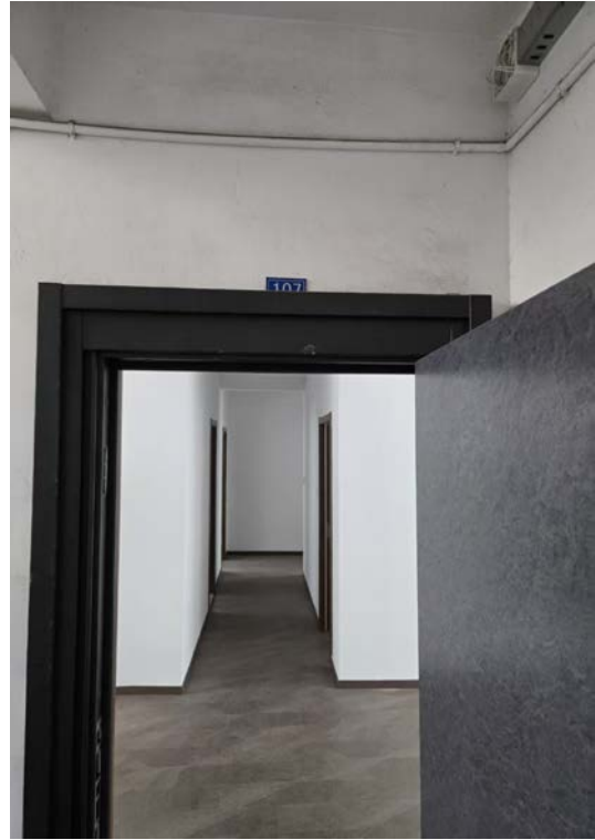
青果花苑 11 幢 107 室