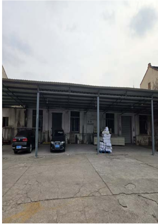
云亭太平路 24 号内