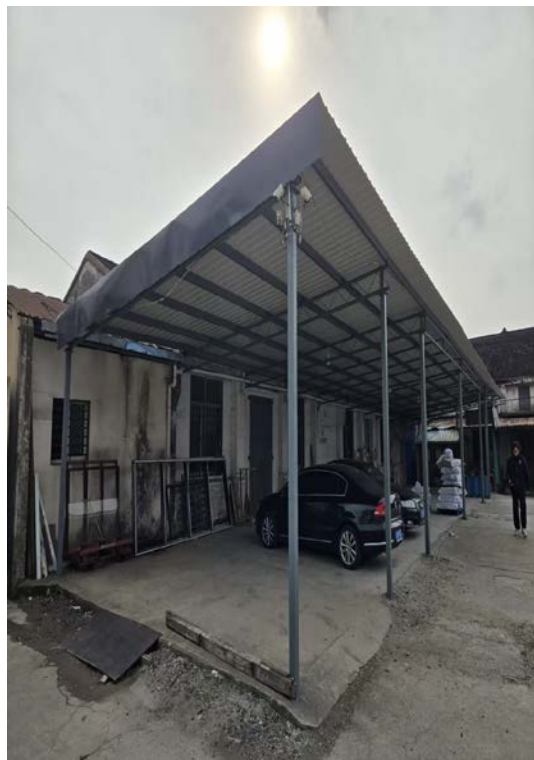
云亭太平路 24 号内