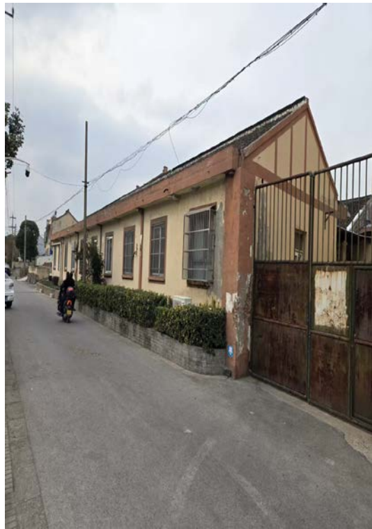
云亭太平路 24 号内