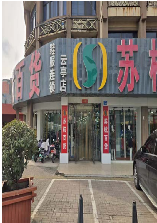
云亭太平路 24 号内