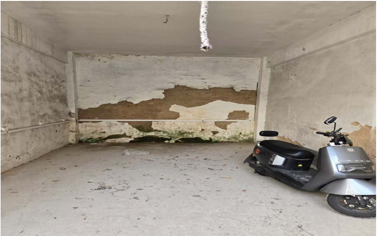
澄江中路 26 号内车库 25