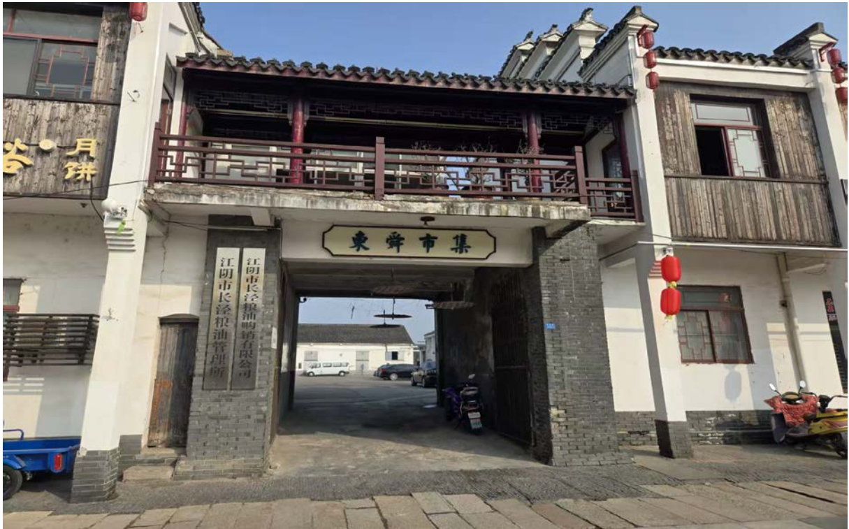
长泾河北街 222 号