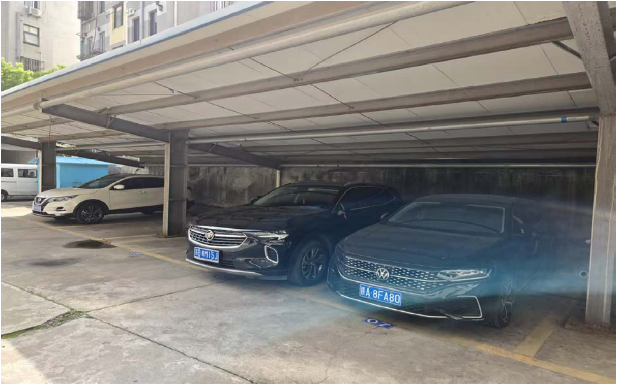
澄江中路 26 号内车位 1、2、3、5、6、7