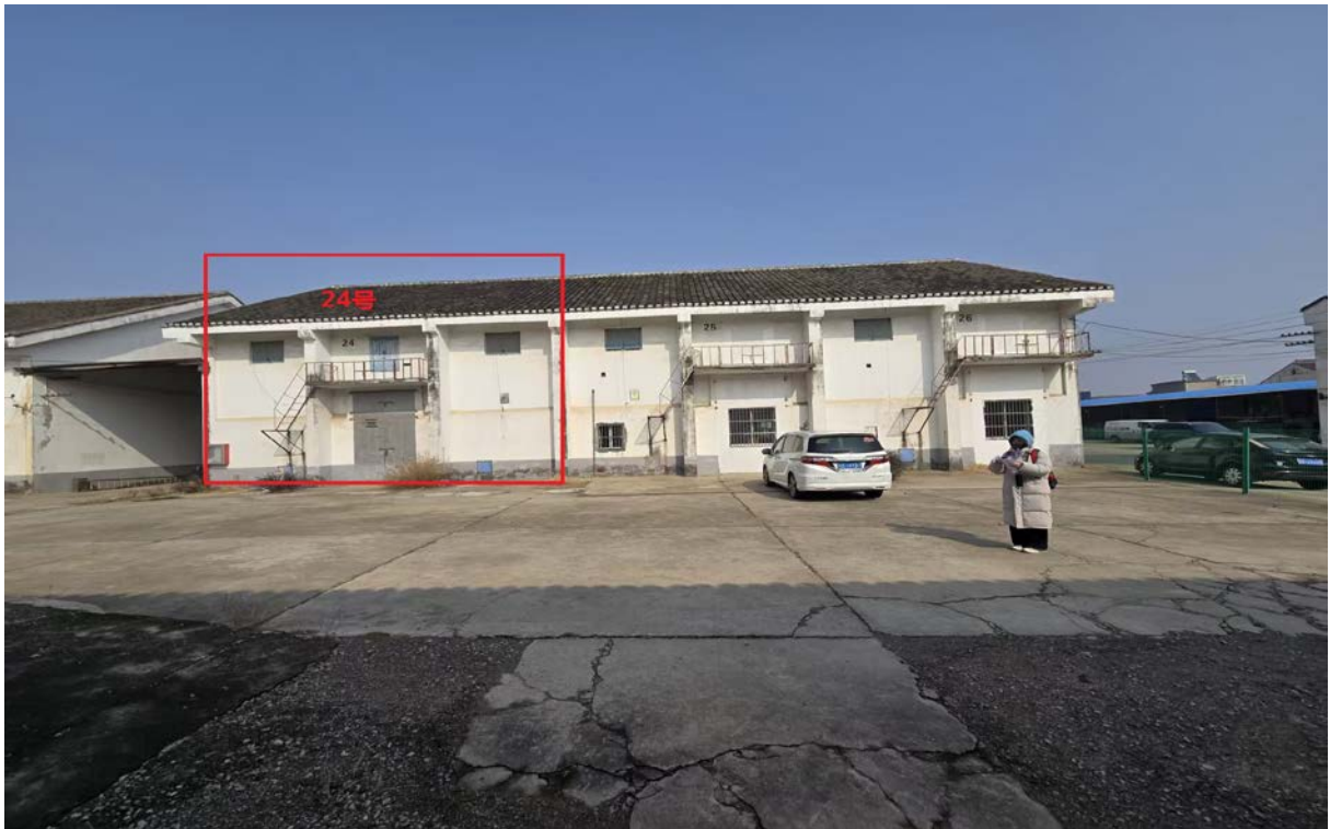
长泾河北街 222 号内 24 号仓