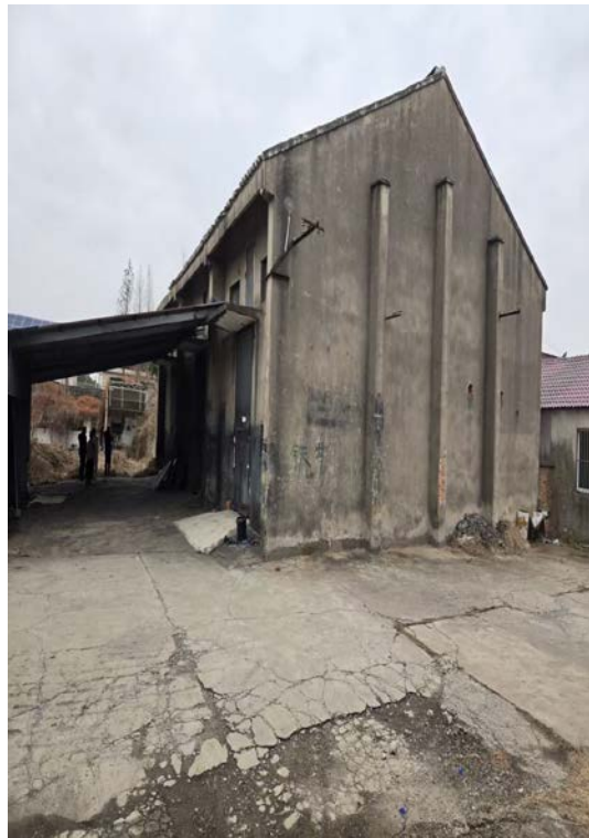
新桥苏墅桥 68 号仓库及辅房