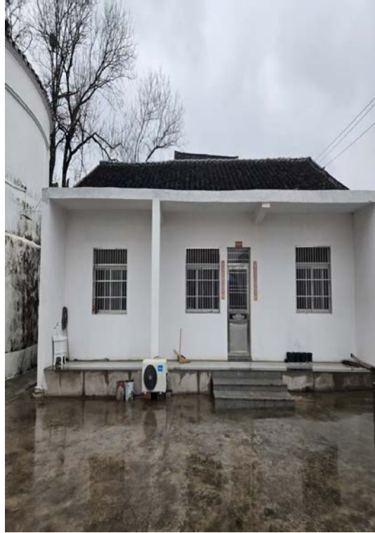
横土迎宾东路 59 号内