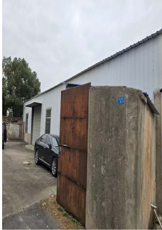
新桥苏墅桥 68 号自建房