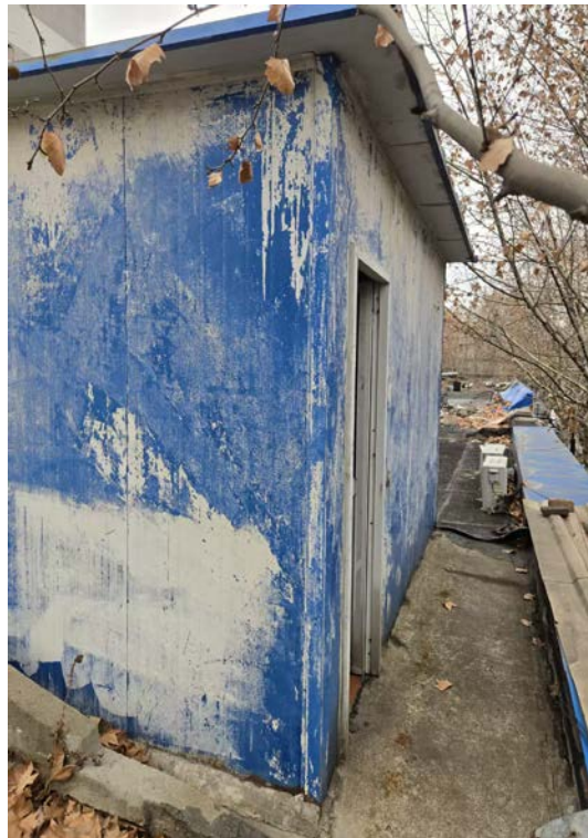
澄江健康路 71/73 号及搭建 (健康路 53 号)