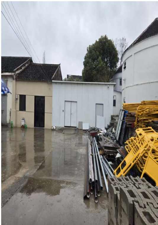
横土迎宾东路 59 号内