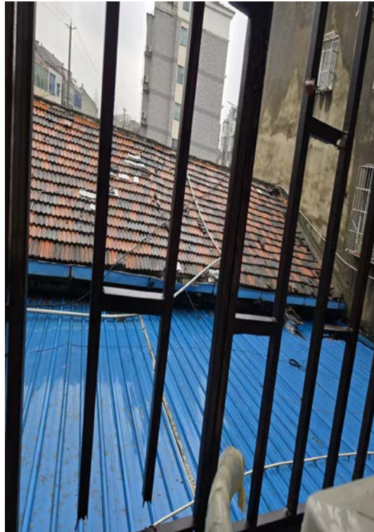
利港利中街 149 号