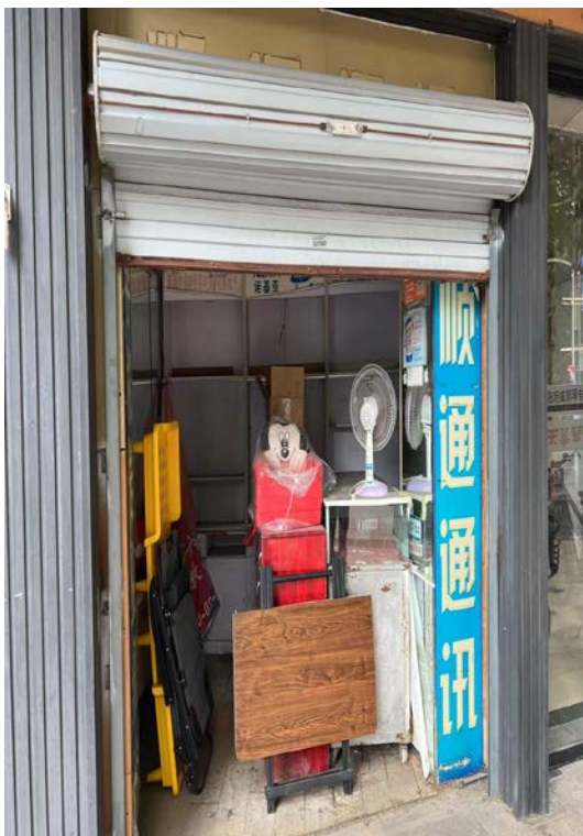
人民中路 196 号楼梯间