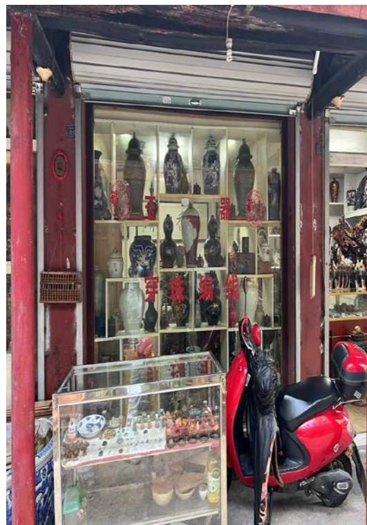
民间文化市场 A 区 15 号