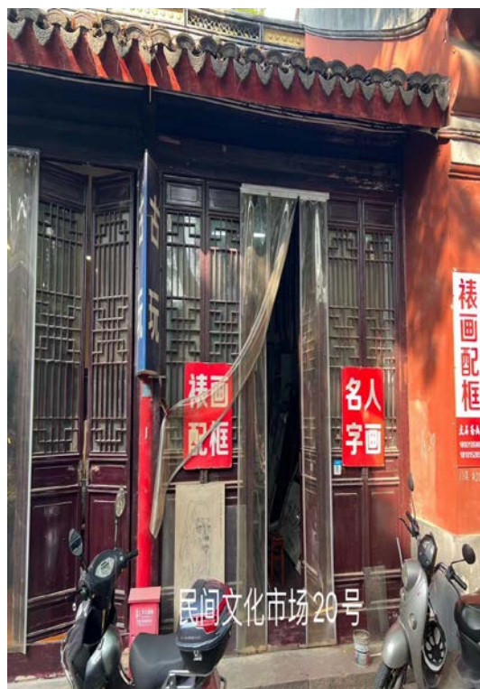
民间文化市场 A 区 20 号