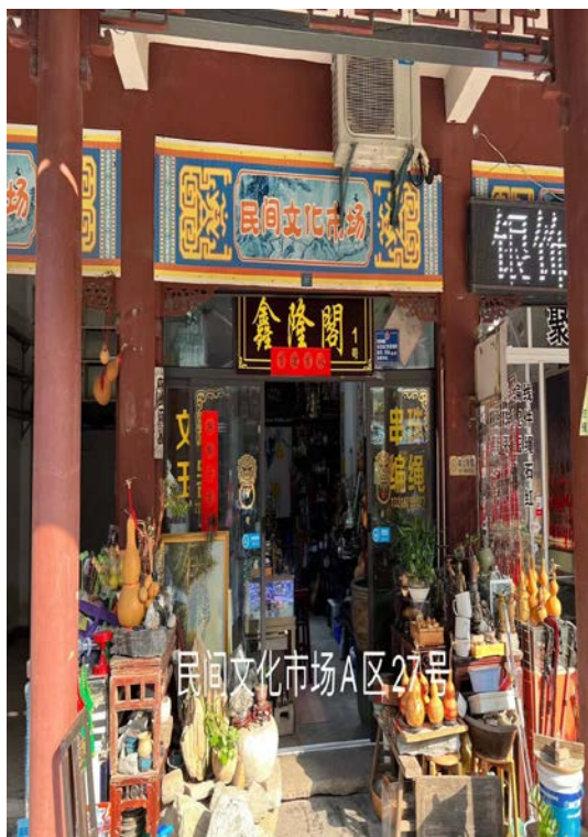
民间文化市场 A 区 27 号