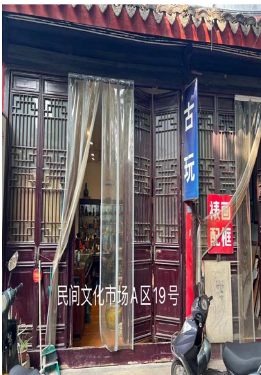
民间文化市场 A 区 19 号