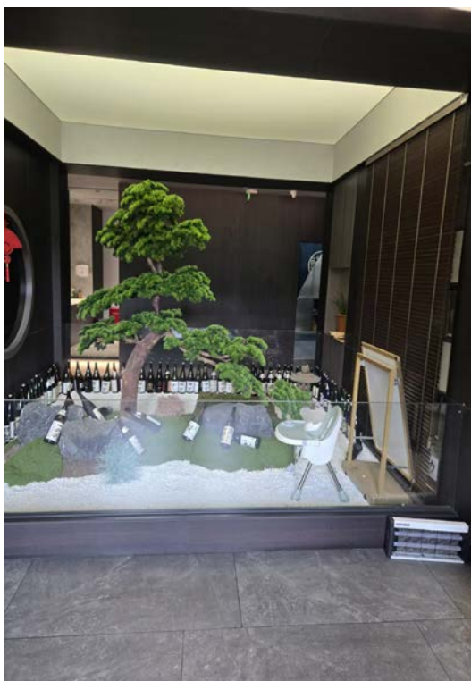
江阴市澄江中路 29 号 A 座 2 号-1