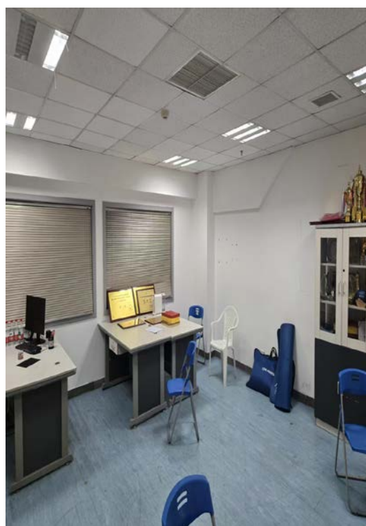
市民水上活动中心 5 号门一楼