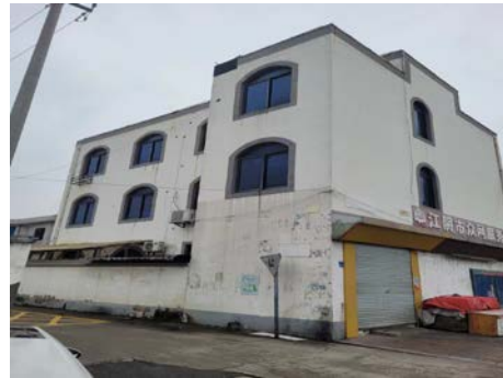
陆桥荷花南路 19 号