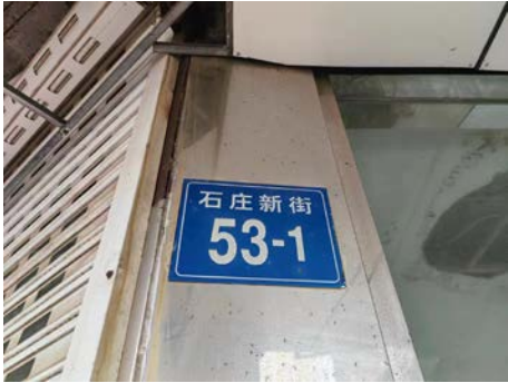
石庄新街 53-1 号