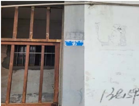
陆桥荷花南路 19 号