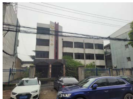
峭岐惠民路 73 号