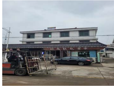
陆桥荷花南路 17 号