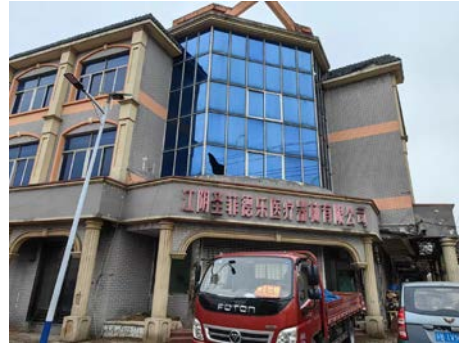
石庄新街 53-1 号