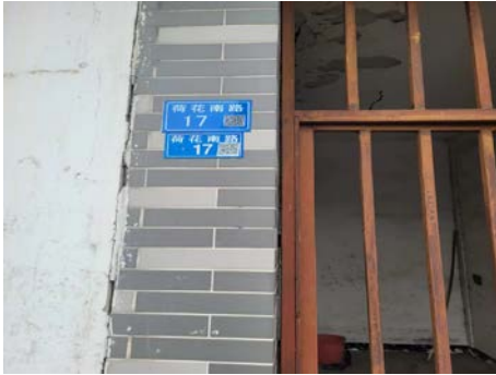
陆桥荷花南路 17 号