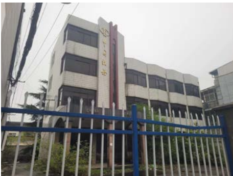
峭岐惠民路 73 号