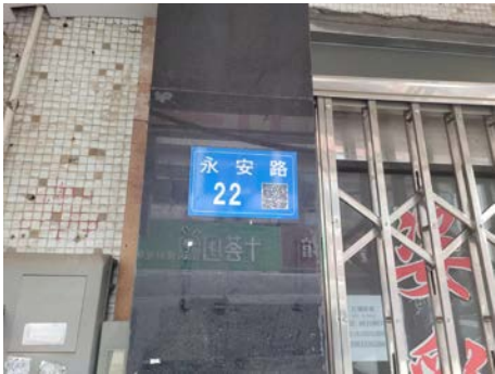
长寿永安路 22 号