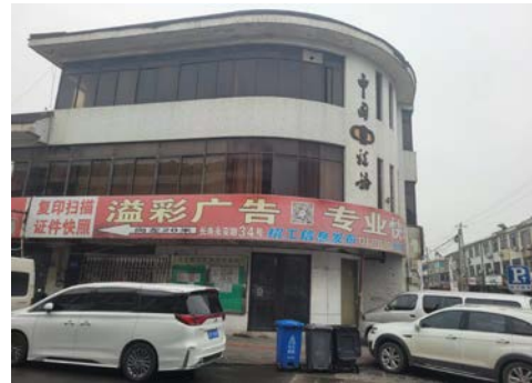
长寿永安路 22 号